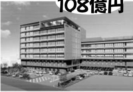
▲ [新庁舎の北側 外観イメージ]

今回の予算で市は、総額108億円、庁舎部分だけで今の1.5倍の面積となる新庁舎建設に踏み出します。