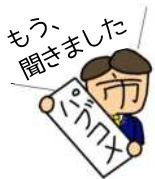
※イメージであり、確定したものではありません。

産業文化会館や保健センターと一体になりますが、庁舎部分だけでも現在の1.5倍以上の大きさです。党議員団は他市の事例も示し「最小限の使いやすい庁舎を」と求めてきました。