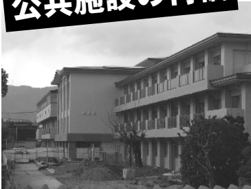
完成間近の神足小

市長は公約で「公共施設の統廃合・集約化・移転・再配置など」をかけた。財政効率化は大事ですが、公共施設は市民の共有財産であり、普段利用しない人でも災害時には必要となるなど、多面的な役割を果たしています。市民参加で進めるべきという指摘に対し、市長は「複数案を提示した説明会や意見交換会などを検討する。市民の意見により変更が生じることもある」「面積削減よりも運営コスト削減を重視」と答えました。