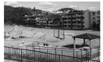
工事中の西代里山公園

公募によって名称が決定した「西代里山公園」は4月に開園します。2万㎡からなる芝生広場、管理棟、農園、イベント広場、ホテル広場、カブトムシの森などが盛り込まれた市内最大の公園です。公園を安心して利用できるよう願う声は多く、特に芝生広場が大雨の際の調整池となることから、管理責任の確立や危機管理マニュアル策定を求めました。