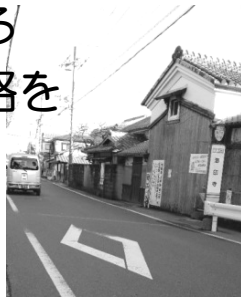
歩道のない通学路

子どもの命を守るために、安全整備が必要な通学路はまだまだまだたくさんあります。市内では特に十分な歩道が確保できていない通学路では、「速度30km規制を設け安全確保をしてほしい」などの要望もあがっています。早急な対応を求めました。