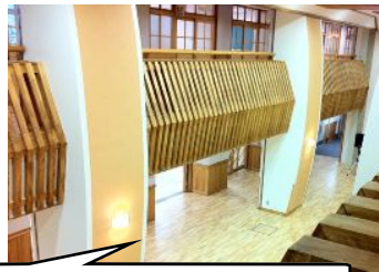
完成した長七小校舎。2階吹き抜け廊下から。