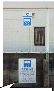
東和苑公園に表示された桂川はんらん時の浸水深