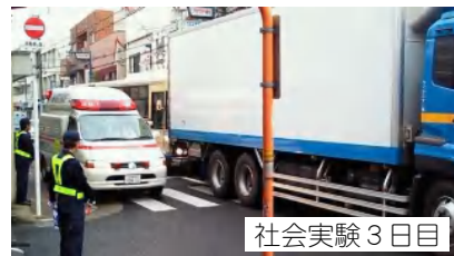
緊急車両が通りにくい場面も。

党議員団は、裏面のアンケートに取り組んでいます。一方通行化への評価だけではなく、そもそもアゼリア通り・天神通りにどんな不便を感じ、どんな対策を願っておられるかをお聞きしています。「バリアフリー化」が市民の声で具体的に前進するよう提言していきます。ご意見をお寄せください。